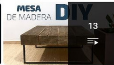
Proyectos de Bricolaje - 2 Temporada