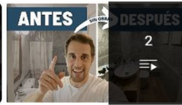
Reformas sin obras