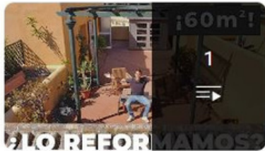
Reforma de Terraza