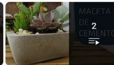
Bricolaje Casero con Cemento