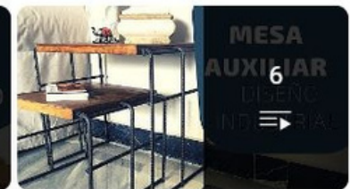
Como hacer una mesa auxiliar