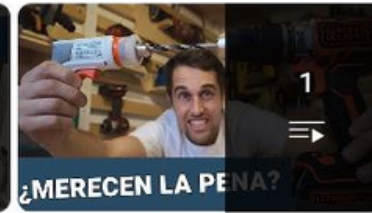
Café con Herramientas