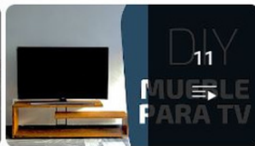
Como hacer una mesa de madera