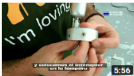
Cómo modificar e instalar una lámpara para añadirle u...