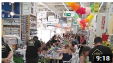
Talleres Leroy Merlín Telde - 2ª parte