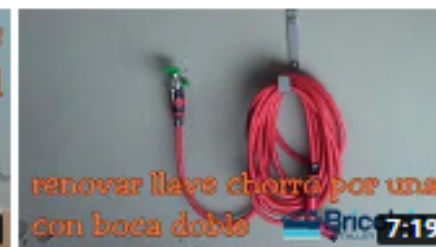
Renovar una llave de chorro por una con boca doble