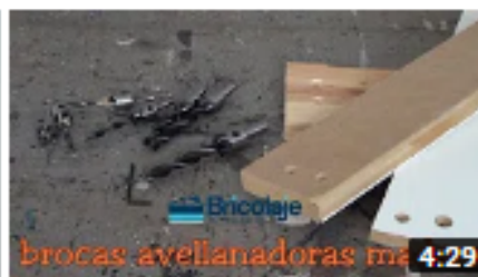
Brocas avellanadoras para madera