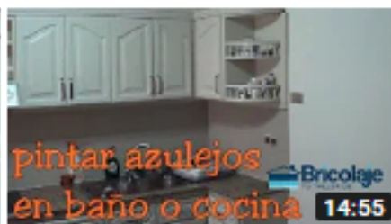
Cómo pintar azulejos en baño o cocina