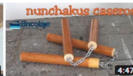
Cómo hacer unos nunchakus caseros