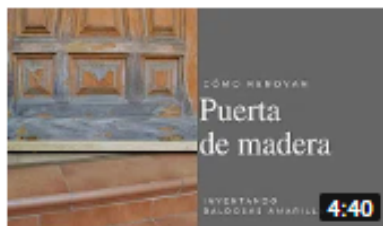
Antes y después de una puerta de madera: cómo... 3,2 mil visualizaciones • Hace 4 meses