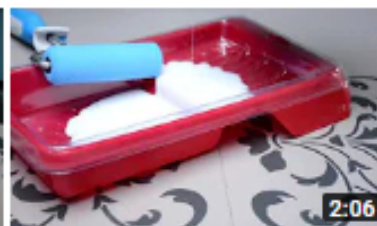
Cómo renovar cocinas sólo con pintura 2,2 mil visualizaciones • Hace 4 meses