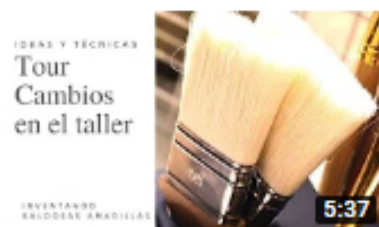
Tour Renovación de nuestro taller: diy, ideas y técnicas 1,2 mil visualizaciones • Hace 3 meses