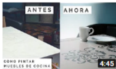
Tutorial cómo pintar muebles de cocina 2,7 mil visualizaciones • Hace 4 meses