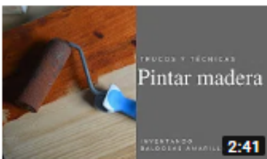
Trucos y técnicas para pintar madera 3 mil visualizaciones • Hace 4 meses