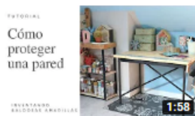
Cómo proteger pared pintada 1,1 mil visualizaciones • Hace 3 meses

Proyectos Decoraciones – Reciclaje – Renovaciones