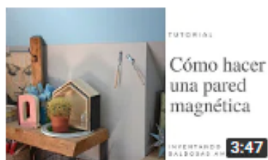
Cómo hacer una pared magnética 959 visualizaciones • Hace 4 meses